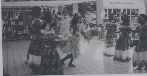
Meninos e meninas dos núcleos de base do Movimento valorizam a cultura negra através das diversas manifestações culturais

um mito entre os negros. A derrota de Palmares aconteceu quando as autoridades da Colônia apelaram para o bandeirante Domingos Jorge Velho, que armou uma expedição contra Palmares, em 1694. Após muita luta, Zumbi foi martirizado e morto no dia 20 de novembro de 1695.