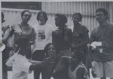
Assembléia Estadual do paran : momentos de descontra o e trabalho prof cuo