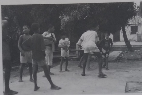
“Ao MNMMR cumpre levar adiante o papel de fortalecer a organização de meninos e meninas, aprofundando as ações pedagógicas lúdicas e formativas nos núcleos de base”